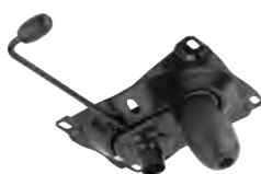
Meccanismo oscillante monoblock con tensionatore