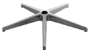
Base piramidale in alluminio d.700