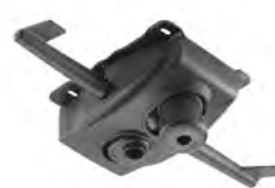
Meccanismo oscillante multiblock 4 posizioni di blocco con tensionatore