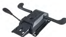
Meccanismo synchro 4 posizioni autoregolante con traslatore