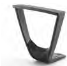
Coppia braccioli fissi TEKNO